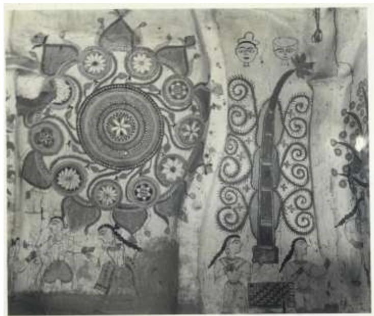
Figura 2: Diseño mithilā para bendecir el Kohbar ghar . Por William Archer, 1935, fotografía Sarmaya, https://sarmaya.in/spotlight/the-walls-have-eyes-the-discovery-and-evolution-of-mithilā-art/

No obstante, la celebración más relacionada con el arte Mithilā es la del matrimonio, en la cual se decora el Kohbar ghar : habitación en la casa de la novia donde la pareja pasa su primera noche de bodas. El tema central de estas pinturas es la fertilidad, y su intención la de bendecir a la pareja que se acaba de unir en matrimonio al de incrementar la potencia sexual de ambos (figura 2). Aparte del Kohbar ghar , también se decoran el Gosai ghar , una habitación especial para los dioses de la familia, y el pasillo fuera del Kohbar ghar . Durante la ceremonia del matrimonio los esposos son separados por las mujeres con el fin de realizar su propia ceremonia devota a Gauri en el Gosai ghar , y en la cual los hombres están prohibidos. Gauri , es la diosa a la cual la novia ha rezado desde niña para conseguir un buen marido.