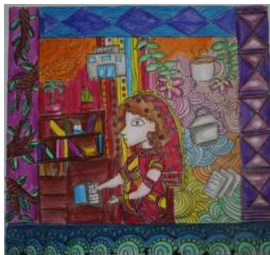
Figuras 5 y 6: Dibujos mithilā realizados por los alumnos de 1º de la ESO en el I.E.S. Padre Manjón, Granada, 2022.