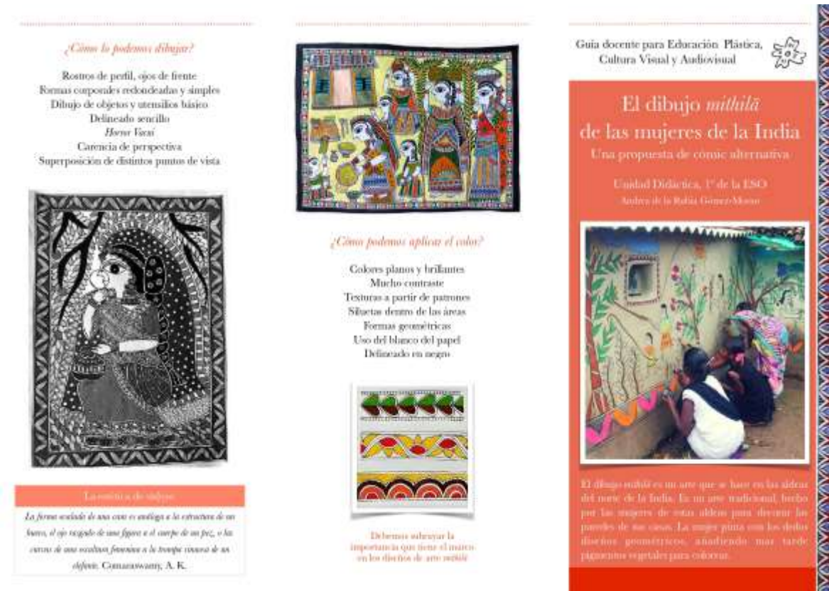
Figura 8: Tríptico explicativo del arte mithilā . Elaboración propia.

mediante la observación directa, la atención y la participación voluntaria del alumnado durante la exposición.