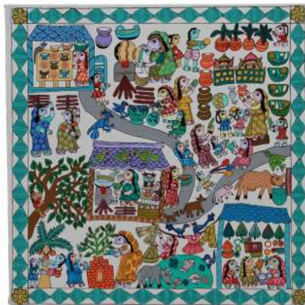
Figura 10: Dibujo mithilā contemporáneo. Por Anmol Kushawaha, fotografía, Pinterest , https://www.pinterest.es/anmolkk91/janakpurdham/

Para el alumnado con evaluación negativa en esta Unidad Didáctica, el profesor elaborará un informe individualizado sobre los objetivos y contenidos no alcanzados y la propuesta de recuperación. Para ello, se pedirá al alumno la entrega del dibujo final completo. Se evaluarán estos dibujos de recuperación siguiendo las pautas de la rúbrica en “Trabajo Final”.