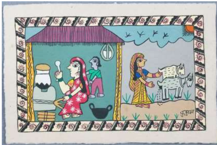
Figura 9: Women's tasks inside and outside the house. Por las artistas de JWDC, arte mithilā , Sunavworld, https://www.sunavworld.com/shop/mithila-folk-art-vegetable-cart-selling-veges-yn4pc