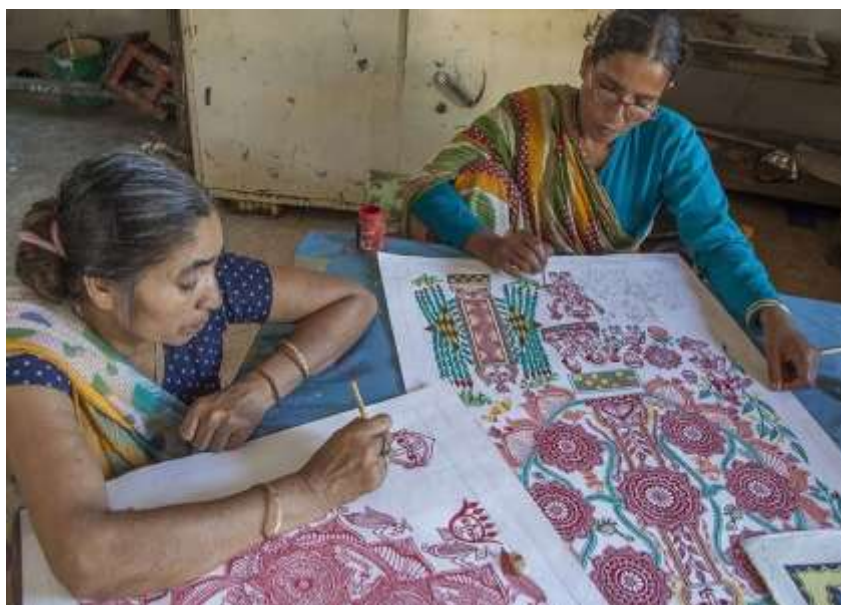
Figura 3: Mujeres creando arte mithilā . En Janakpur Women's Development Center (JWDC), India

ancestrales de representación de imágenes, ya sean religiosas o escenas de su propia vida y sociedad actual (Figura 3).