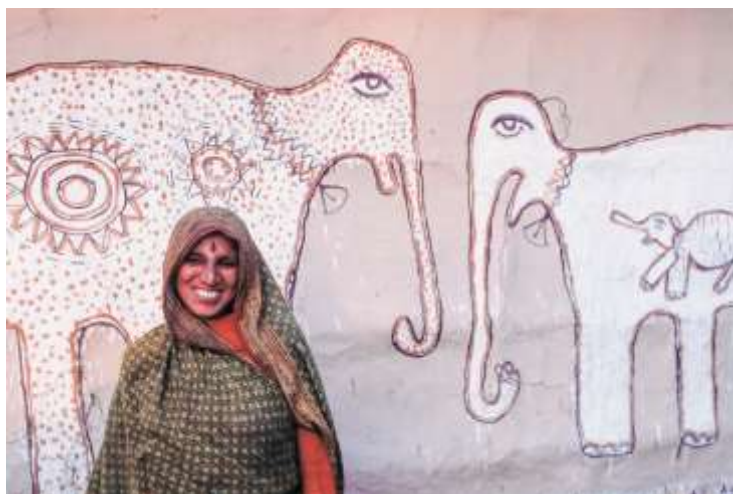
Figura 1: Arte mithilā en la zona de Nepal. Por Claire Burkert, 2021, fotografía, Hinduism Today , https://www.hinduismtoday.com/magazine/jul-aug-sept-2021/meet-the-maithil-women-artists-of-nepal/

Mithilā era la capital del antiguo Reino de Videha, el cual abarcaba el actual Estado de Bihar al norte de la India, y el Estado de Mithilā al sur de Nepal. Este Reino cayó tras la firma del Tratado de Sigauli en 1816, a través de la cual el Rey de Nepal accedía a la British East Indian Company una gran parte de su territorio fronterizo, poniendo fin así a la guerra anglo-nepalí comenzada dos años atrás, en 1814. No obstante, la cultura mithilā , transmitida de madres a hijas por rito y tradición desde el siglo XIV, prevaleció hasta el día de hoy. Dentro de esta cultura esencialmente agrónoma, el papel femenino en este tipo de arte ritual resulta fundamental. Ya que son las mujeres de las aldeas las encargadas de realizar estos dibujos narrativos en las paredes de sus casas, durante las fiestas dedicadas a las divinidades hindúes o la unión en matrimonio para propiciar la fertilidad. Para ello, utilizan una pasta natural generada con arroz molido, agua y pigmentos vegetales, aplicándolos después con sus propios dedos sobre la pared de barro. Los colores elegidos tienen siempre un significado tanto religioso como social. Por ejemplo, mientras que el rojo se suele utilizar para representar la energía femenina de la Sákti , el verde se aplica a elementos naturales como hojas y tallos.